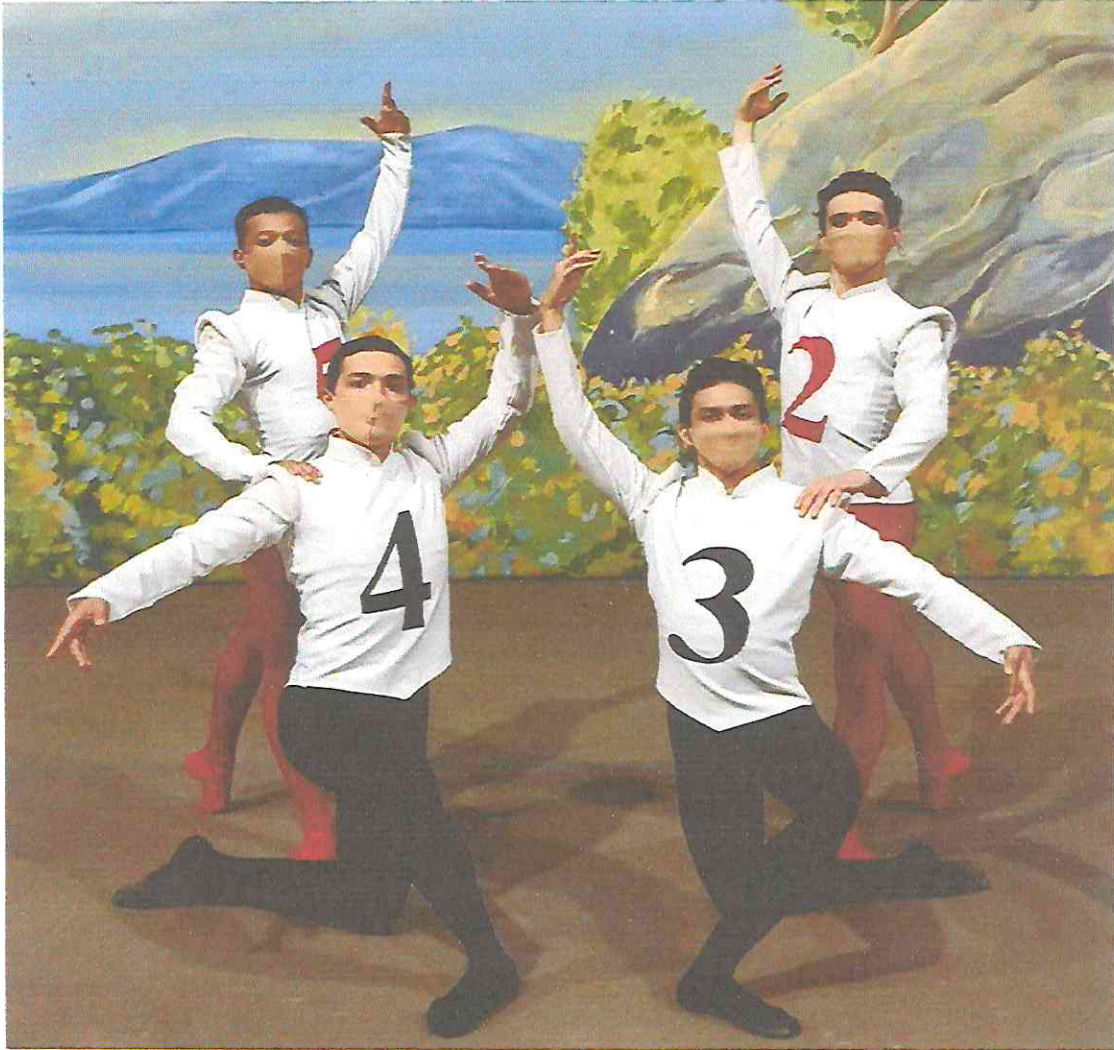
Las Aventuras de Alicia en el País de las Maravillas