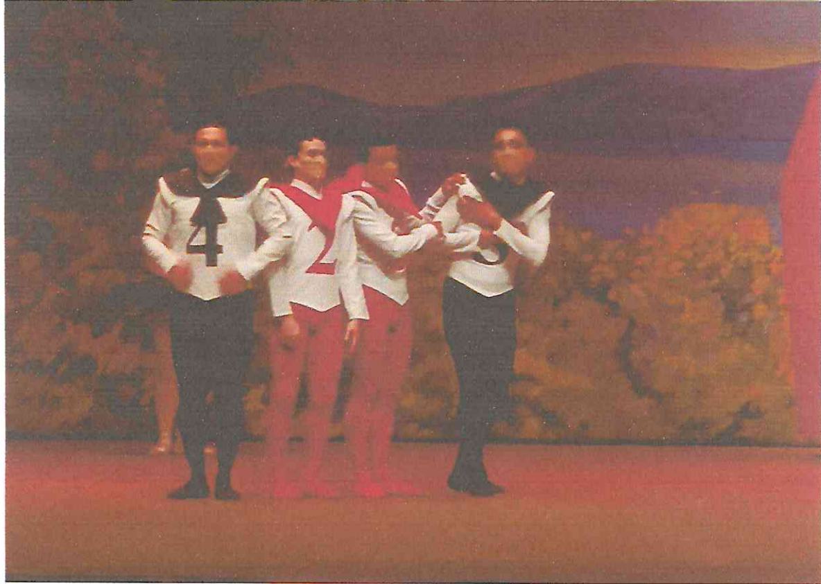
Las Aventuras de Alicia en el País de las Maravillas (Pajes de la Reina de Corazones y Reina de Corazones) Abril 2022