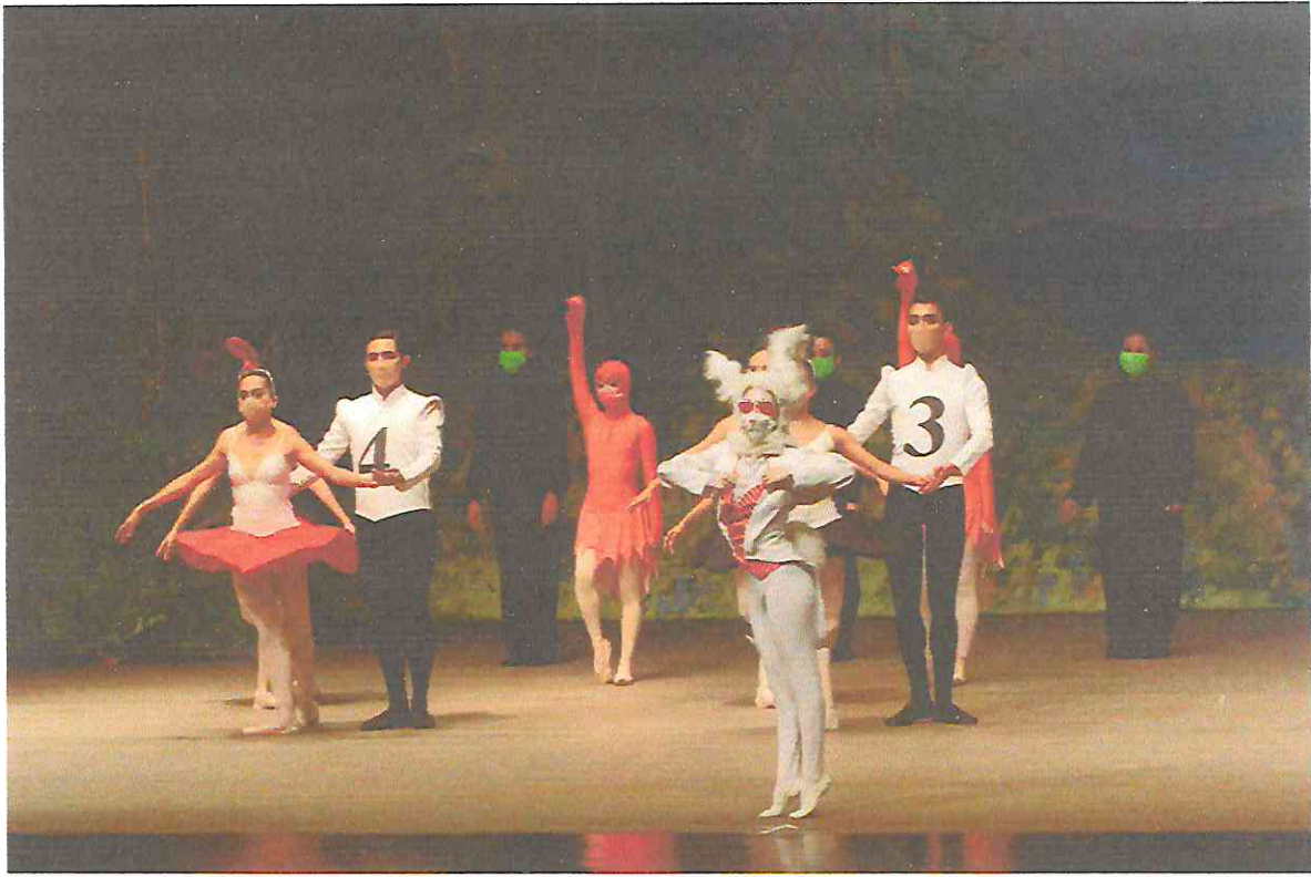
Saludo Final de la obra Las Aventuras de Alicia en el País de las Maravillas.