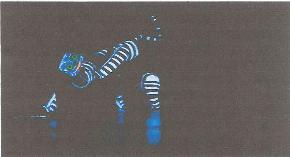
Escena de Luz Negra (Escena del Gato) Abril 2022