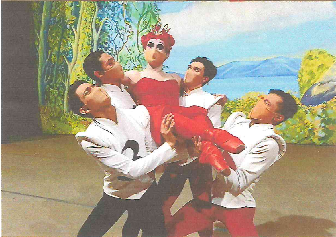
Las Aventuras de Alicia en el País de las Maravillas (Pajes de la Reina de Corazones y Reina de Corazones) Abril 2022